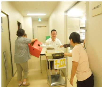
シナモンを利かせたチェロスは本場の味！！

より担当職員と利用者さんが協力して会場の飾り物や景品の準備を行ってきました。当日会場となった本館食堂は、夏祭り会場に一変し、景品交換所やお菓子交換所には楽しそうな利用者さんの笑顔が溢れていました。