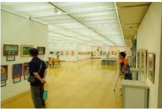
和やかな雰囲気の中で展示