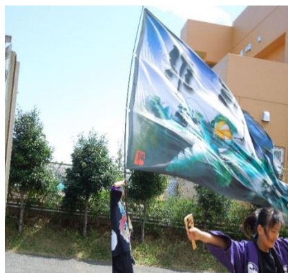
← 熱気に包まれた演技会場