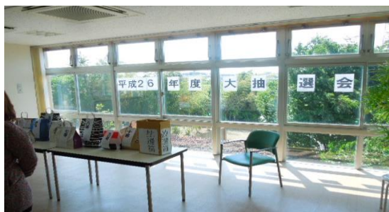
盛大に実施された抽選会(会場:食堂)

うらかな小春日和、左記の日時に誕生会が開催されました。午前中には維新メンバー有志が来園され、よさこいを披露しました。後半では、利用者も踊りの輪に入り盛大に盛り上がりました。