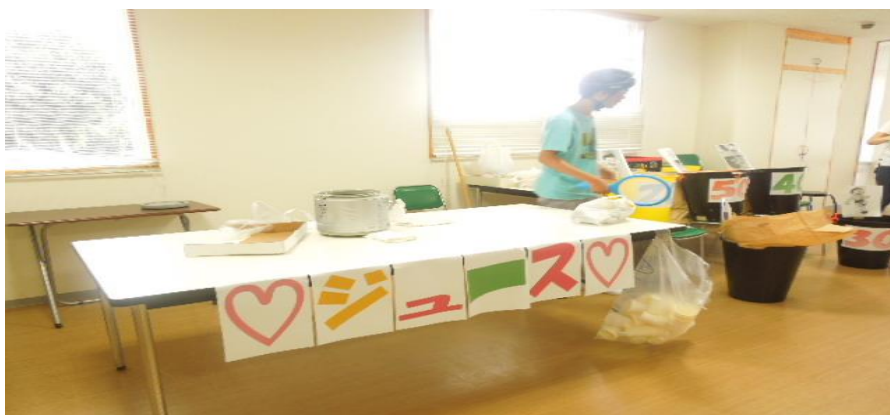
にぎやかな模擬店も勢揃いして会場を盛り上げます！！